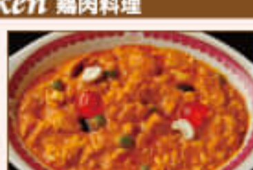
25. Chicken Hyderabadi ¥1,360 チキン ハイドラバード

Barbecued chicken pieces cooked with cashew nuts paste, fresh cream, fresh butter, wild spices カシューナッツペースト、生クリーム、バター、スパイスで 味付けしたバーベキューチキンカレー