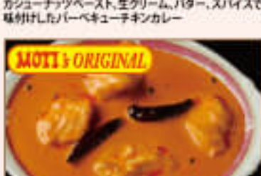
29. Chicken Barta ¥1,390 チキンバルタ

Boneless chicken cooked with chopped green spinach, garlic, ginger, tomato ほうれん草、ニンニク、生姜、トマトを使用した 骨なしチキンカレー