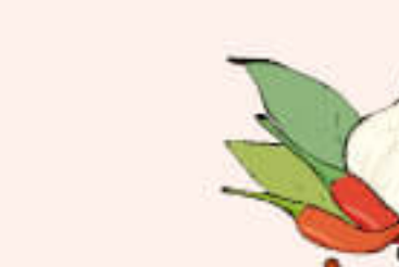
22. Moti Butter Chicken ¥1,550 モティバターチキン

Fried Potatoes tossed with hot spices フライドポテトを香りがにスパイスで味付けした料理