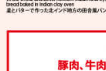
47. Tandoori Prantha (Plain) ¥480 タンドーリパンタ (1pcs.)

Whole wheat and butter southern Indian rural style bread baked in Indian clay oven 蒸しバターで作った北インド地方の田舎風パン