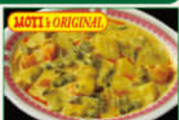
14. Navrattan Curry ¥1,390 ナブラタンカレー

Fresh cauliflower and potatoes cooked in medium spices ポテトとカリフラワーをマイルドに味付けした料理