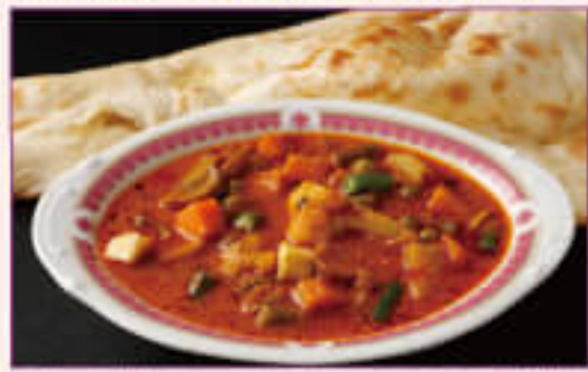
C. Vegetable Curry with Nan or Rice Set ¥1,050 野菜カレーとナンまたはライスセット