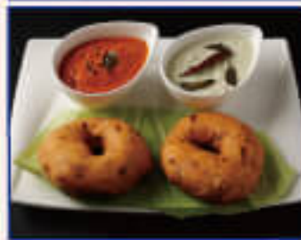
Sambar Vada サンバルワダ