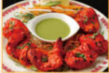
6. Special Punjabi Tikka ¥1,260 スペシャル パンジャビ ティカ (6P)

Special barbecue boneless Chicken cooked with yogurt and spices 骨なしの鶏肉をヨーグルトとスパイスで調理した特製バーベキューチキン