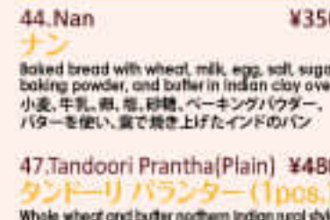
44. Nan ¥350 ナン

Baked bread with wheat, milk, egg, salt, sugar, baking powder, and butter in Indian clay oven 小麦、牛乳、卵、砂糖、ベーキングパウダー、 バターを使い、窯で焼き上げたインドのパン