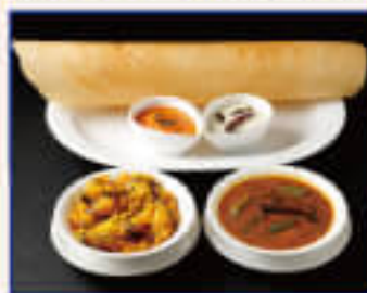
Masala Dosa マサラドサ