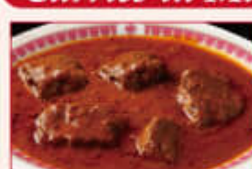
30. Mutton Rogan Josh ¥1,390 マトン ローガン ジョシュ

Mutton cooked in rich gravy and spices グレービーソースとスパイスで味付けした マトンカレー