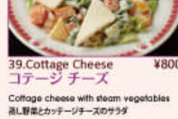
39. Cottage Cheese ¥800 コテージチーズ

Fresh vegetable (lettuce, tomato, cucumber, onion, radish etc.) フレッシュなサラダ (レタス、トマト、きゅうり、玉ねぎ、ラディッシュなど)