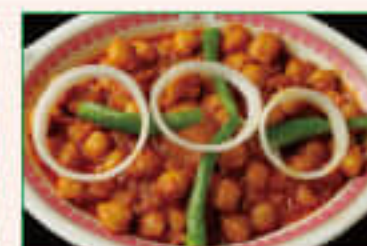
20. Channa Masala ¥1,250 チャナマサラ

Roasted eggplant cooked with green peas, tomatoes and onion 薫かしたナス、グリーンピース、トマトと玉ねぎのカレー