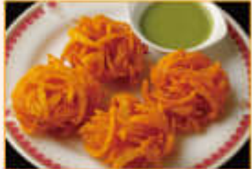
2. Onion Bhaji ¥840 オニオン バジ (4P)

Roll up fried potato, onion, bean, green peas, spices traditional Indian light meal ポテト・玉ねぎ・グリーンピース・スパイスを皮に包み、インドの代表的なフライドスナック