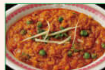
19. Baigan Barta ¥1,350 バイガン バルタ

Home-made cottage cheeses add to fresh tomato sauce cooked with mild spices 自家製ホワイトチーズとトマトソースを使ったマイルドなカレー