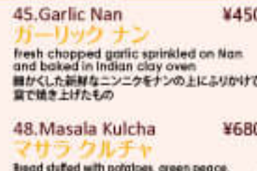
45. Garlic Nan ¥450 ガーリックナン

Baked bread with wheat, milk, egg, salt, sugar, baking powder, and butter in Indian clay oven 小麦、牛乳、卵、砂糖、ベーキングパウダー、 バターを使い、窯で焼き上げたインドのパン