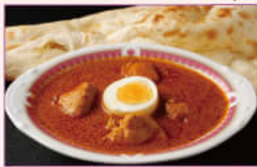
B. Chicken Curry with Nan or Rice Set ¥1,050 チキンカレーとナンまたはライスセット