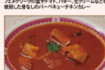
27. Chicken Murtani ¥1,365 チキン ムルタニ

Chicken in curry sauce cooked with spring onion, and green pepper, green peas 玉ねぎ、トマト、グリーンピース、グリーンペッパーなど を使用したチキンカレー