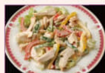
42. Oriental Chicken ¥800 オリエンタルチキン

Steam prawn southern island dressing, green vegetable, mayonnaise 蒸し海老とマヨネーズで南国風に味付けした 蒸し海老のサラダ