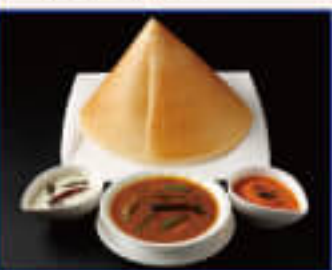
Plane Dosa プレーンドサ