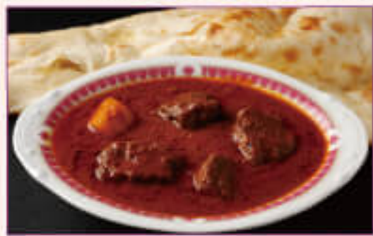
A. Mutton Curry with Nan or Rice Set ¥1,050 マトンカレーとナンまたはライスセット

月~金 承ります。 Mon to Fri LUNCH OK! ※土日祝除く ※Sat, Sun & Holiday ×