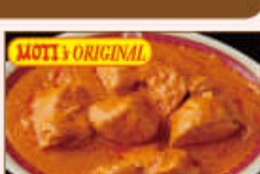
26. Chicken Do Piazza ¥1,360 チキンドー ピアザ

Chicken cooked in Hyderabad style with tomatoes, hot spices, butter and coconuts flakes トマト、ホットスパイス、バター、ココナツフレークを 使用したインドのハイドラバード地方のチキンカレー