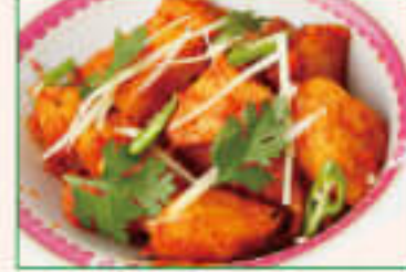
21. Bombay Alu ¥1,260 ボンバイアルー

Chic beans cooked with hot spices, Indian style ヒヨコ豆をスパイスで味付けしたインド風豆料理