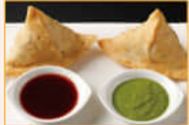
1. Samosa (2 pcs.) ¥630 サモサ (2P)

Roll up fried potato, onion, bean, green peas, spices traditional Indian light meal ポテト・玉ねぎ・グリーンピース・スパイスを皮に包み、インドの代表的なフライドスナック