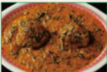
16. Palak Kofta ¥1,370 バラクコフタ

Home-made cheese cooked with chop green spinach and garlic, ginger, tomato 細かくしたほうれん草とニンニク、生姜、トマトの 自家製ホワイトチーズカレー