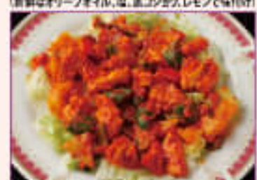
43. Spicy Chicken ¥800 スパイシーチキン

Slice chicken with green vegetable, salt, mayonnaise スライスしたチキンと野菜を塩やマヨネーズで 味付けしたサラダ