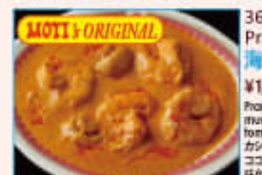
36. Prawn Curry ¥1,420 海老カレー

Prawn cooked with cashew nuts, mushrooms, coconuts flakes, tomato sauce カシューナッツ、マッシュルーム、 ココナツフレーク、トマトのソースで 味付けした海老のカレー