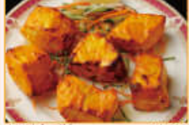
10. Fish Tikka ¥1,680 フィッシュ ティカ

Prawn with fresh cream, cheese, coconuts flw, grilled on skewers in Tandoori 新鮮なクリームチーズ、良質なココナツで味付けしてタンダーで密焼きにした海老