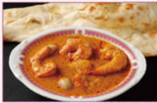
D. Prawn Curry with Nan or Rice Set ¥1,050 海老カレーとナンまたはライスセット