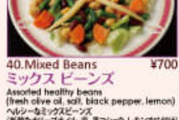
40. Mixed Beans ¥700 ミックスビーンズ

Cottage cheese with steam vegetables 蒸し野菜とカッテージチーズのサラダ