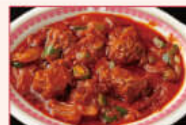
33. Mutton Do Piazza ¥1,360 マトンドー ピアザ

Mutton cooked with brown onion, beaten eggs and spices ブラウンオニオンソース、溶き卵、スパイスで 味付けしたマトンカレー