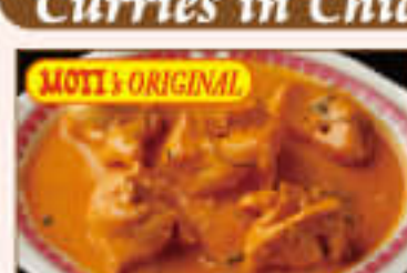
24. Chicken Tikka Masala ¥1,550 チキン ティカ マサラ

Boneless chicken cooked with cashew nuts, raisins, fresh spinach, cottage cheese カシューナッツ、レーズン、ほうれん草、カッテージチーズ などを使用した、骨なしのバーベキューチキンカレー