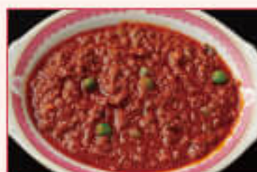
35. Keema Mutter Curry ¥1,360 キーマ マタール カレー

Mutton cooked with green chopped spinach, garlic, ginger, tomatoes ほうれん草、ニンニク、生姜、トマトを細かく刻んだ マトンカレー