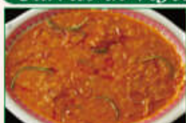
12. Dal Darbari ¥1,280 ダルダルバリ

Yellow lentils cooked with onion, garlic, ginger, tomato, butter 玉ねぎ、ニンニク、生姜、トマト、バターで 味付けした豆カレー