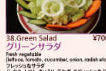
38. Green Salad ¥700 グリーンサラダ

Fresh vegetable (lettuce, tomato, cucumber, onion, radish etc.) フレッシュなサラダ (レタス、トマト、きゅうり、玉ねぎ、ラディッシュなど)