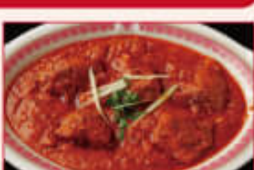
32. Mutton Rara ¥1,390 マトン ララ

Mutton and minced mutton cooked with spice 羊の挽肉をスパイスで味付けしたマトンカレー