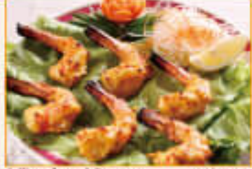
9. Tandoori Prawn ¥1,880 タンドーリ ブラウン (6P)

Grilled minced mutton with garlic and ginger, chop fresh onion on skewers in Tandoori 羊の挽肉に、みじん切りにした玉ねぎ、生姜、ニンニクを混ぜ合わせタンダーで密焼きにしました