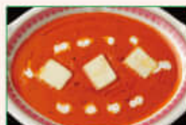
18. Panir Butter Masala ¥1,470 パニール バター マサラ

Home-made cottage cheeses add to fresh tomato sauce cooked with mild spices 自家製ホワイトチーズとトマトソースを使ったマイルドなカレー