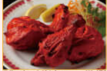
7. Tandoori Chicken ¥1,470 タンドーリ チキン (3P)

Special barbecue boneless Chicken cooked with yogurt and spices 骨なしの鶏肉をヨーグルトとスパイスで調理した特製バーベキューチキン