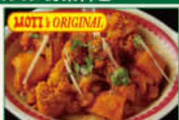
13. Alu Gobi ¥1,350 アルーゴビー

Yellow lentils cooked with onion, garlic, ginger, tomato, butter 玉ねぎ、ニンニク、生姜、トマト、バターで 味付けした豆カレー