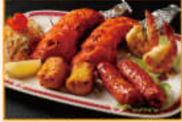
11. Mix Barbecue Set ¥1,740 ミックスバーベキューセット (2人)

Grilled barbecue white med fish with tomato, garlic, ginger and cashew nuts, served with mint sauce 白身魚をトマト・ニンニク・生姜などに漬け込み、タンダーで焼きました。ミントソースでお召し上がり下さい。