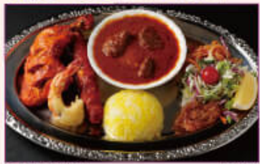
E. Mix Grill Set ¥1,400 ミックスグリルセット

※You can choose your favorite curry お好きなカレーをお選びいただけます