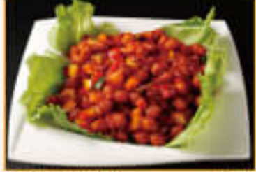
5. Channa Chili ¥700 チャナ チリ