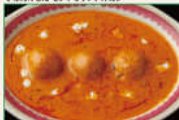
17. Malai Kofta ¥1,390 マライコフタ

Spinach balls cooked with vegetable sauce in traditional Indian style 野菜のソースで味付けしたベジタブルボールの ほうれん草カレー