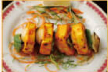
3. Panir Tikka ¥1,365 パニール ティカ

Spicy crisp fried onion with mint sauce traditional Indian style スパイスで味付けしたフライドオニオンをミントソースで