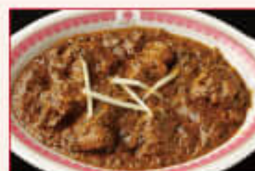
34. Sag Mutton ¥1,390 サグマトン

Mutton in mild sauce cooked with spring onion and green pepper, tomatoes, green peas 玉ねぎ、グリーンペッパー、トマト、グリーンピースで 仕上げたマイルドなソースのマトンカレー