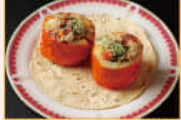
4. Tandoori Alu ¥800 タンドーリ アルー

Grilled barbecue snack with home-made cottage cheese, onion, panir, paprika, special sauce on skewers in tandoori 自家製カッテージチーズ・玉ねぎ・パプリカを利にし、特製のカレシをつけてタンダーで焼いたバーベキューチキン