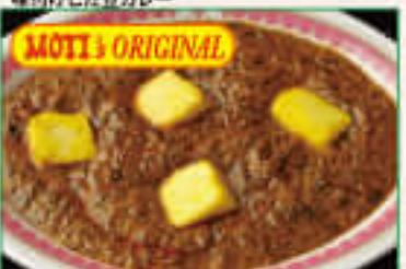
15. Palak Panir ¥1,370 バラクパニール

Assorted different kinds of vegetables, cashew nuts, raisin, fresh cream, mild gravy 9種類の野菜・カシューナッツ・レーズン・生クリーム で味付けしたモティオリジナルカレー