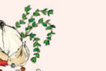
23. Chicken Zanjiri ¥1,490 チキン ジャンジリ

Barbecued boneless chicken cooked with fresh tomato, fresh butter, cashew, with tangy red フェタチーズの量やトマト、バター、生クリームなどを 使用した骨なしのバーベキューチキンカレー