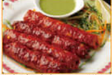
8. Sheek Kabab ¥1,350 シーク カバブ (4P)

Indian barbecued chicken with butter and different spices, yogurt sauce in Tandoori バター、各種スパイス、ヨーグルトソースで味付けし、タンダーで焼いたインド風バーベキューチキン