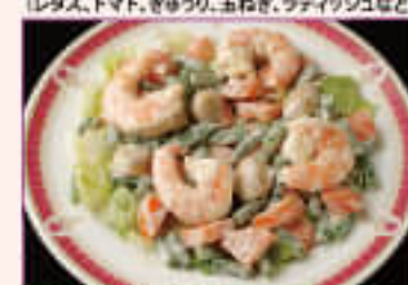
41. Prawn Salad ¥900 海老サラダ

Assorted healthy beans (fresh olive oil, salt, black pepper, lemon) ヘルシーなミックスビーンズ (新鮮なオリーブオイル、塩、黒コショウ、レモンで味付け)