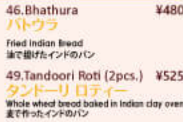
46. Bhathura ¥480 バトウラ

Fresh chopped garlic sprinkled on Nan and baked in Indian clay oven 細かくした新鮮なニンニクをナンの上にふりかけて 窯で焼き上げたもの